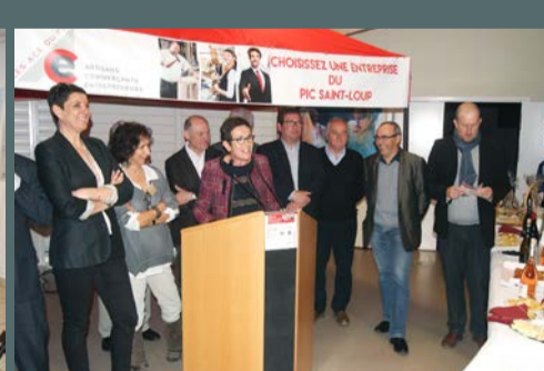
Salon des ACE organisé par Les ACE du Pic, les 9 et 10 avril