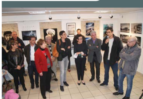
Festimege organisé par la municipalité, du 8 au 10 avril