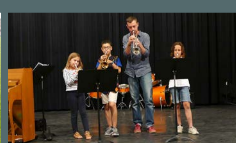
Auditions de l'école de musique Le Diapason, le 17 juin