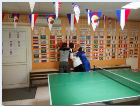
Atelier préparation du mondial du foot