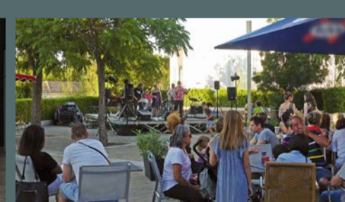
Soirée estivale organisée par Cœur de village, le 23 juin