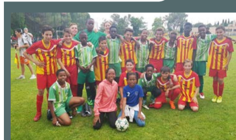
Une équipe de foot guadeloupéenne sur la commune, le 10 juin