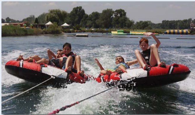
Sortie bouée tractée, à Aigues-Mortes