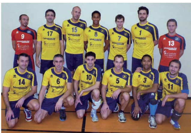
L'équipe de volley seniors du SGVB

Président du Volley-ball Club Saint-Gillois. Autant dire que la route vers l'accession en Nationale 3 est bien dans la ligne de mire !