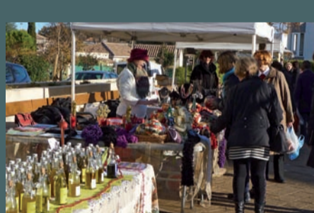
L'association Cœur de village fête Noël le 15/12/12