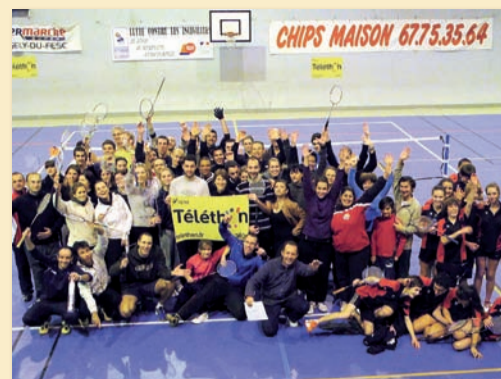
Au tableau d'affichage des sportifs : 70 joueurs, 144 matchs.

Le Club de Bad' a proposé des matches caritatifs dans la salle Maurice Bousquet, de 20h à 2h du matin, et la municipalité, en partenariat avec les "Scribes du 34" a présenté la pièce de théâtre "La Testamente", une comédie drôle, vive et aux personnages bien campés, dans la salle culturelle de l'espace G. Brassens, à 20h30. Au total, près de 700 € ont été récoltés pour le Téléthon.