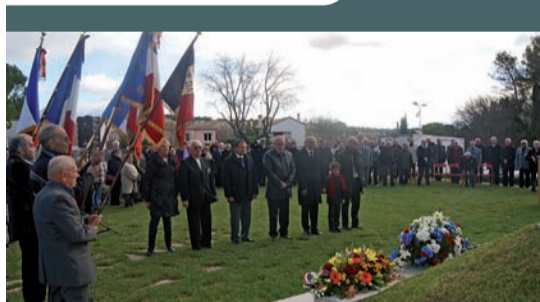
Commemoration Algérie Tunisie Maroc le 5/12/12