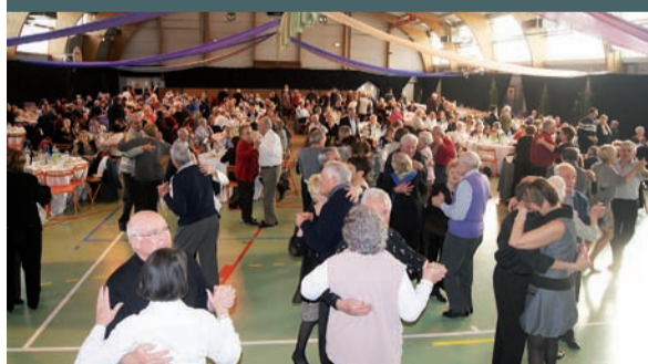
Repas des aînés organisé par la municipalité le 12/01/13