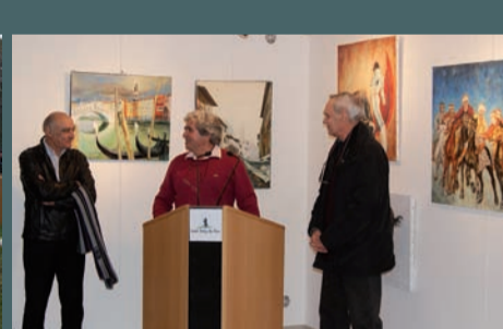
Exposition de peintures de F. Sabater, du 8/01 au 15/01/13