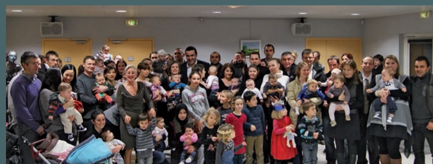
Réception des bébés saint-gillois le 25/01/13