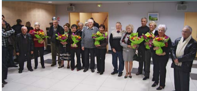
Cérémonie des noces d'or, le 12/02