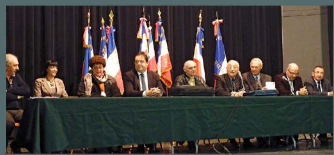
L'assemblée générale des anciens combattants de Saint-Gély/Pic-Saint-Loup, le 03/02