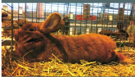
Salon de l'aviciculture, les 26 et 27/01