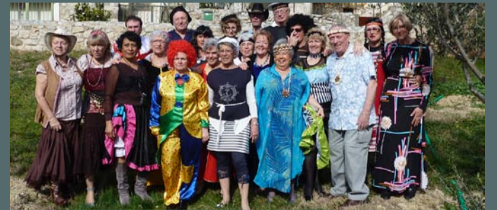
La Saint-Valentin et sa Majesté Carnaval ont fait bon ménage au sein du club DYNAMIC, le 14/02